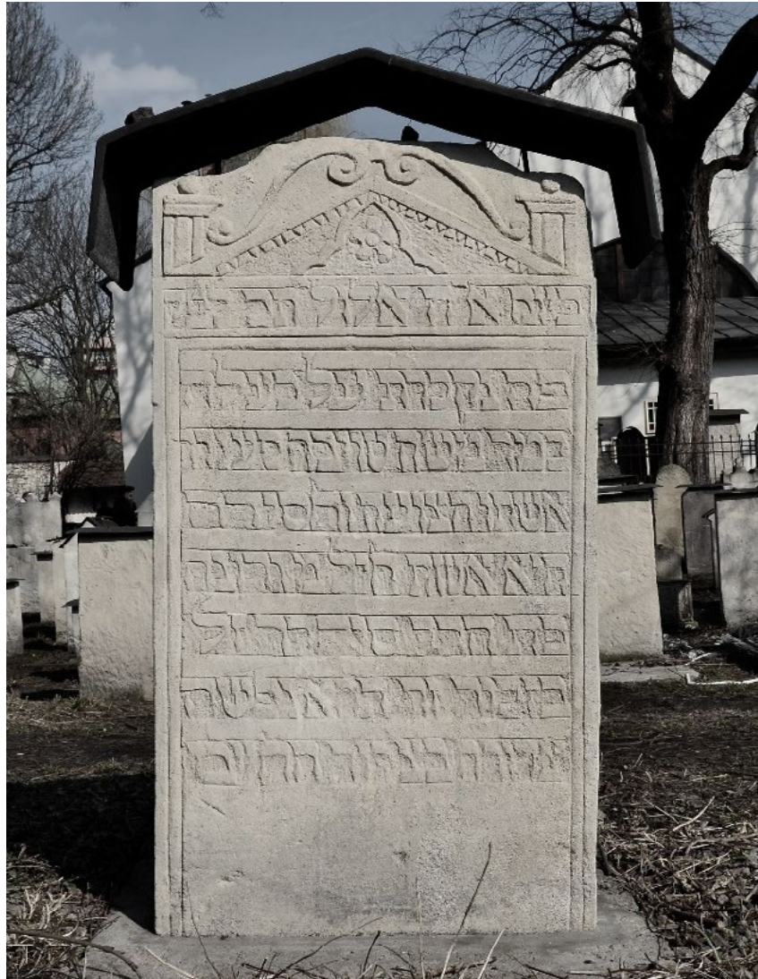
Cmentarz żydowski Remu w Krakowie

Podczas pobytu na cmentarzu mężczyźni muszą nosić nakrycie głowy. Oznaką oddania szacunku zmarłemu jest położenie na grobie kamyka. W ostatnich dekadach coraz częściej na nagrobkach widuje się kwiaty i znicze, nie jest to jednak tradycyjny zwyczaj żydowski.