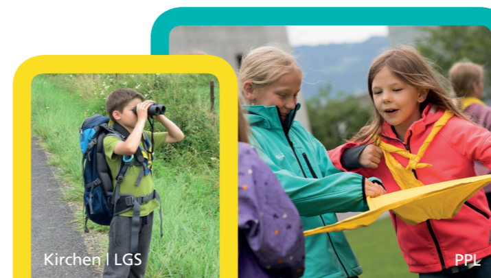
Kirchen | LGS

Hier gibt es Anregungen das Thema in eurem Umfeld und euren Gruppenstunden zu nutzen.