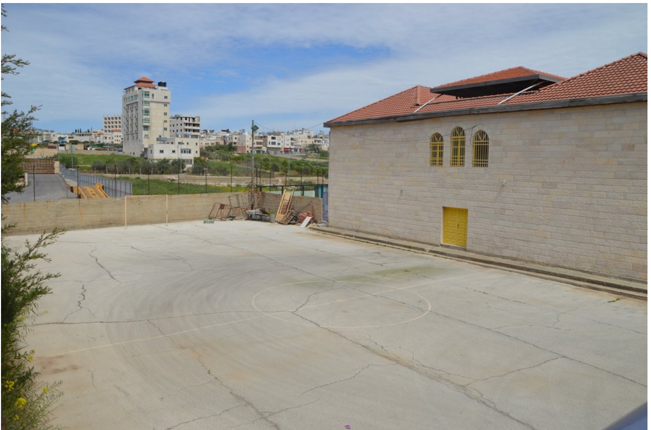
Ilustracja 4: Szkoła wraz z boiskiem i dostępnym zapleczem dla uczestników obozu