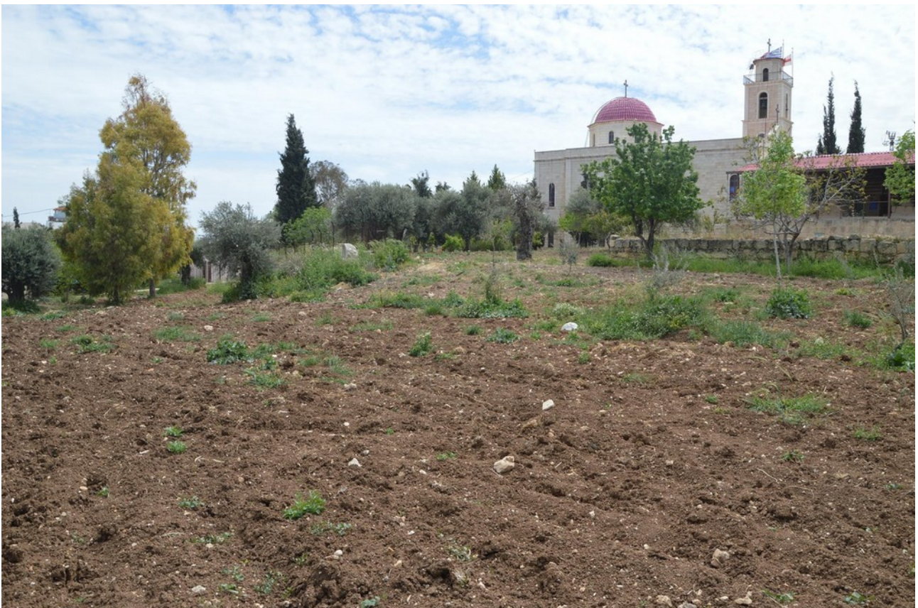
Ilustracja 2: Teren obozu na tyłach parafii przy gaju oliwnym