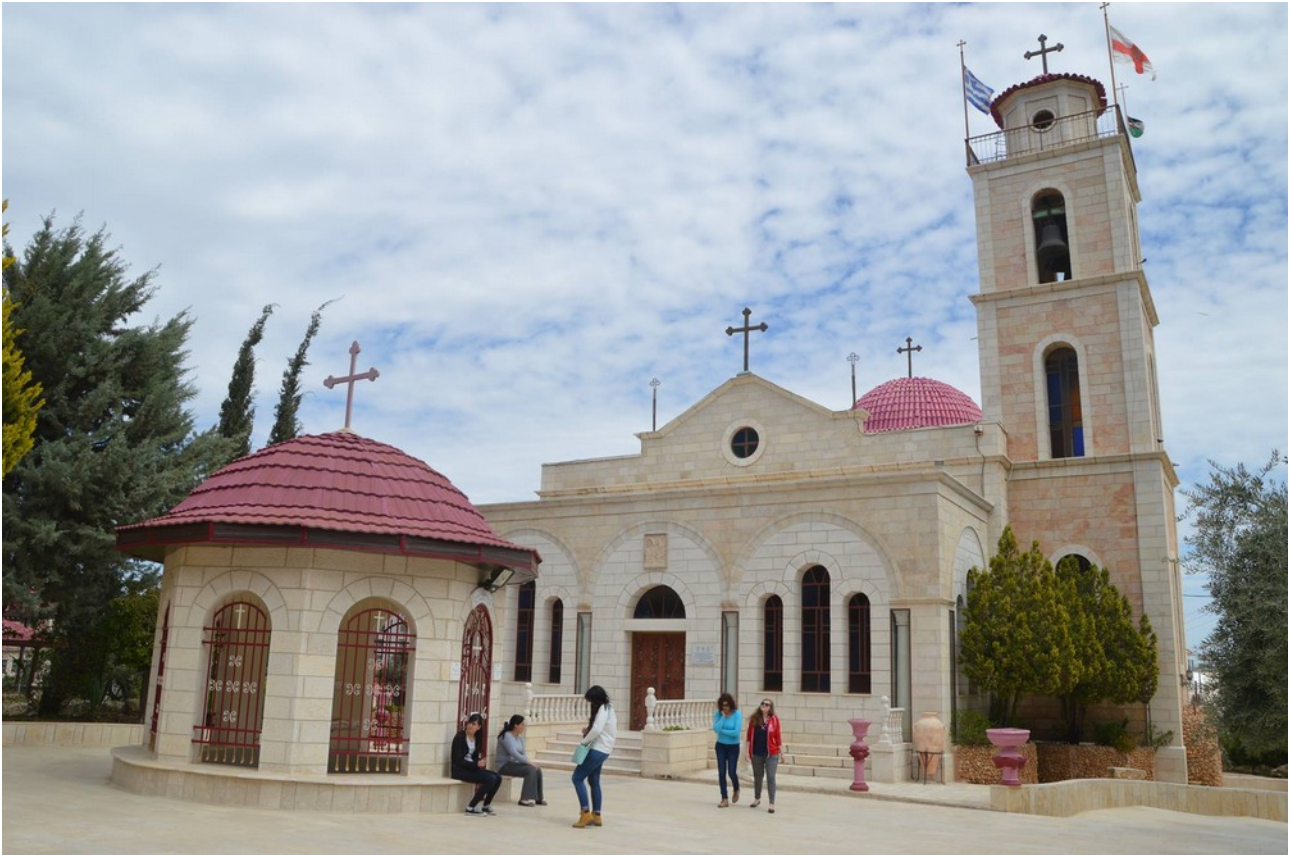
Ilustracja 1: Parafia prawosławna w miejscu obozu (Pole Pasterzy)