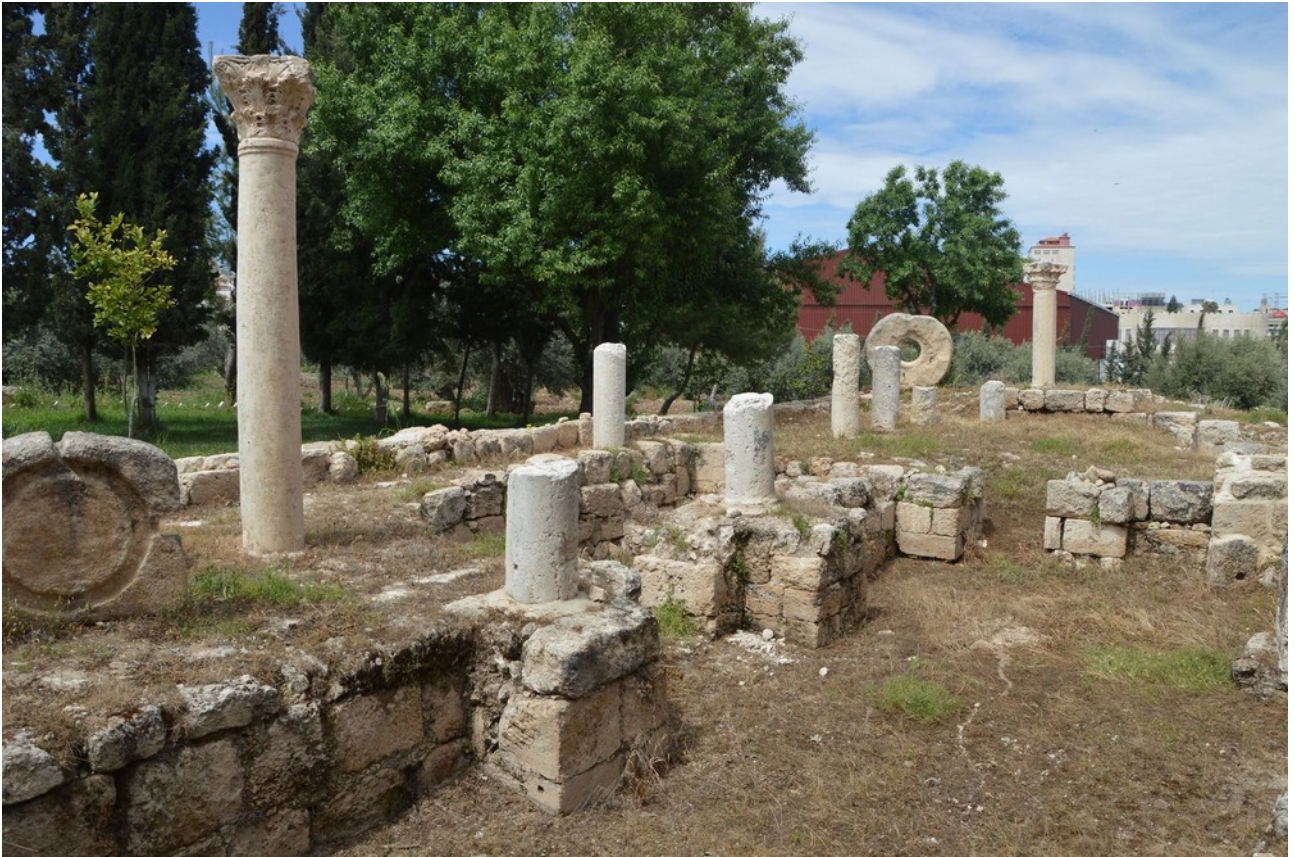
Ilustracja 3: Starożytne ruiny na miejscu obozu